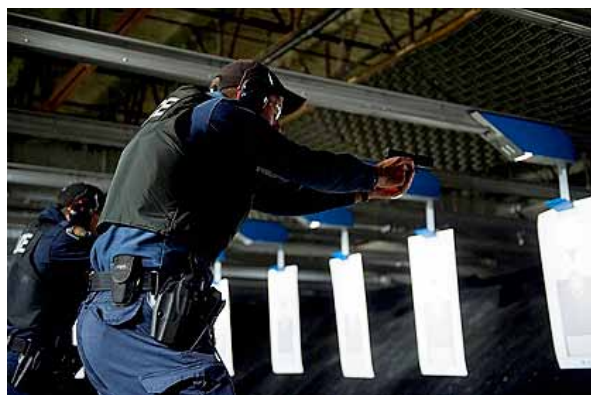
Un officier en cours de sa formation sur l'usage de la force

Durant l'année, on a mené une recherche et préparé des plans de leçons pour améliorer la formation sur les compétences en communication et en désamorçage, qu'on présentera aux agents à compter de 2014.